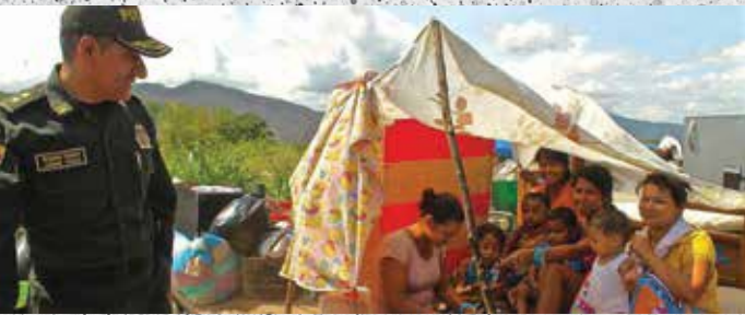
哥倫比亞一個難民營的難民。據估計，難民人數高達400萬，超過該國人口的10%（維基共享資源）。