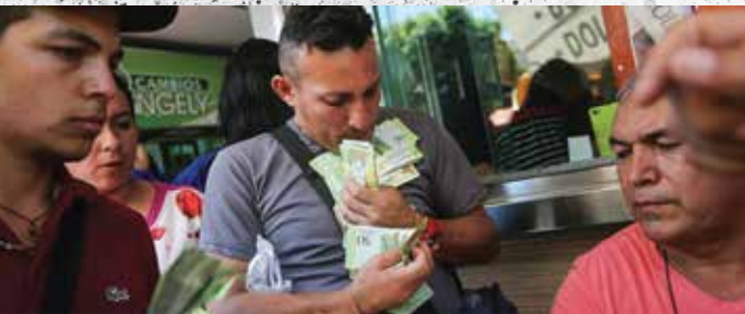
由於委內瑞拉的危機，有100萬人進入哥倫比亞。通貨膨脹使得錢幾乎毫無價值。