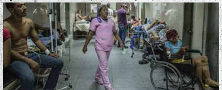
等待緊急護理的患者在委內瑞拉拉克魯斯港的Luis Razetti醫院走廊。拉丁美洲國家的經濟危機已經爆發成為突發的公共衛生事件。

不幸的是，由於委內瑞拉政府經常不受人道主義的援助，因此很難捐贈物品或資金。但是，請繼續為那裡的惡劣情況和生活在其中的人們祈禱。我們必須相信上帝會垂聽我們的禱告，也看到我們想要為身處於如此艱難環境的兄弟姐妹們代禱的渴望。