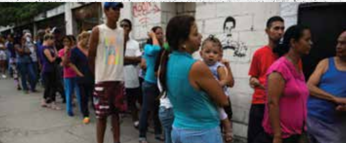
由於政府定量配給，惡性通貨膨脹和石油危機導致經濟陷入危機，委內瑞拉在加拉加斯受難的人們需要幾個小時才可以獲得麵粉和肥皂等基本物品。唯一的另一種選擇，就是在黑市中購買物品。