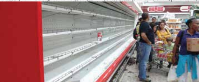
根據一項關於破壞性經濟危機和糧食短缺影響的大學新研究，委內瑞拉人報告說，去年平均體重下降了24磅，現在幾乎有90%的人生活在貧困之中。