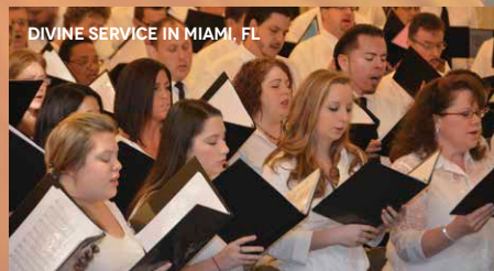
DIVINE SERVICE IN MIAMI, FL