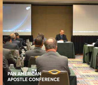
PAN AMERICAN APOSTLE CONFERENCE