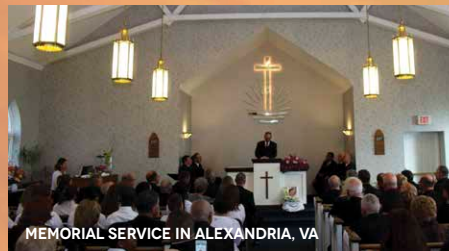
MEMORIAL SERVICE IN ALEXANDRIA, VA