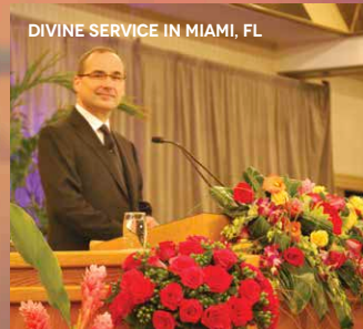
DIVINE SERVICE IN MIAMI, FL