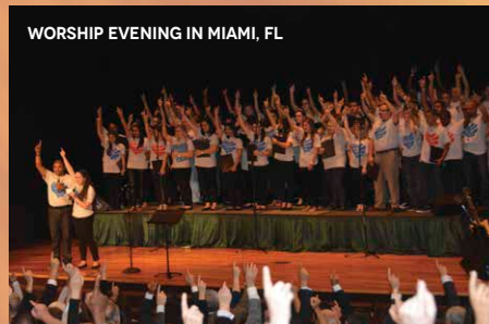
WORSHIP EVENING IN MIAMI, FL