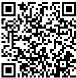
kijitabu cha THRIVE