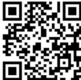
NAC Marekani programu ya simu